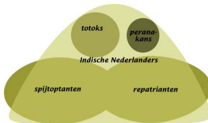
Figuur 1.2 Samenstelling onderzoeksgroep Indische Nederlanders (Kirsten Vos)

De Indische gemeenschap (figuur 1.1) heeft niet dezelfde samenstelling als Indische Nederlanders die repatrieerden (figuur 1.2). Het is een lastig onderscheid, maar van wezenlijk belang voor dit document. Kort gezegd heb ik Indische Nederlanders opgevat de mensen die repatrieerden en bestaat de Indische gemeenschap uit de koloniale bevolking in Indië en Indonesië. Trekkers die voor de Tweede Wereldoorlog teruggegaan waren naar Nederland, horen niet bij de onderzoeksgroep Indische Nederlanders 4 , maar de spijtoptanten , tot Nederlander genaturaliseerde warga negara's , wel. Sommige Indo-Europeanen en warga negara's door de Nederlandse regering niet erkend als Indische Nederlanders. Zij zijn achtergebleven in Indonesië.